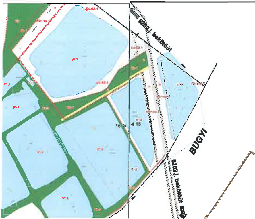
013 hrsz-ú önkormányzati közút Taksony közigazgatási határtól Bugyi közigazgatási határig